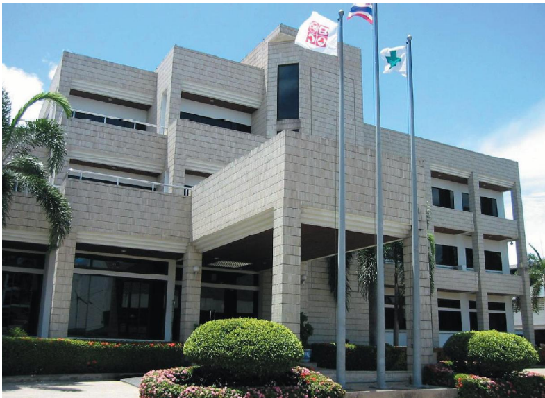
Hiflofiltro: Fabrik in Thailand