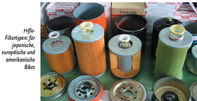
Hiflo- Filtertypen: für japanische, europäische und amerikanische Bikes

druck zwingt die Hersteller auch beim Thema Filter zum Sparen. Damit kann Hiflofiltro als Spezialist die Leistungen originaler Filter häufig deutlich übertreffen. Entgegen der Mär erlischt auch die Garantie bei Verwendung eines Austauschfilters NICHT – so lange ein qualitativ gleich- oder höherwertiger Filter verwendet wird. Und diesen Beweis