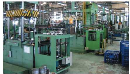
Hiflo: Produktion in Thailand

Bike Alert Plc mit Sitz in London steht hinter Hiflofiltro sowie übrigens auch hinter JT Sprockets; produziert werden die Öl- und Luftfilter von Hiflo in Thailand bei einem grossen Filterhersteller, der seit mehr als 40 Jahren Filter für die Erstausrüstung der Automobilindustrie fertigt, unter anderem für Partner wie BMW, Ford, Peugeot und Toyota.