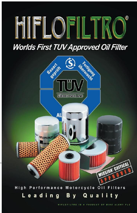
Hiflofiltro: Garantie-Erhalt dank TÜV-Zertifikat

Britischer Spezialist mit Produktion in Thailand macht das Filtergeschäft wieder richtig interessant